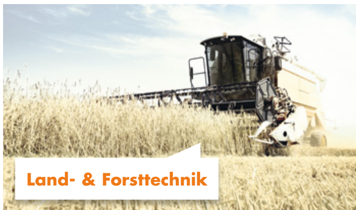
Land- & Forsttechnik